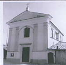
Parrocchia San Filastrio

in occasione dell'inaugurazione del restauro post-terremoto 2004 del Santuario Madonna della Neve