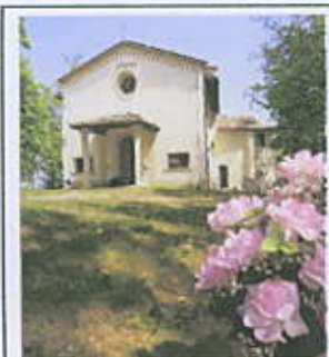
Associaz. Amici Madonna della Neve